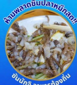
ต้มผักกาดชิบปลาหมึกสด!

โพล้งสเปซวอล์ค สกายวอร์ค ตามรอยซีรีส์ Hometown chachacha ถ่ายรูปชิคๆ หมู่บ้านวัฒนธรรมคิมซอน ขึ้นเคเบิลคาร์ ชมทะเลปูซาน นั่งรถไฟปูคปิก sky capsule ชิมของอร่อยตลาดแฮนแด อิสระช้อปปิ้ง Lotte Duty Free