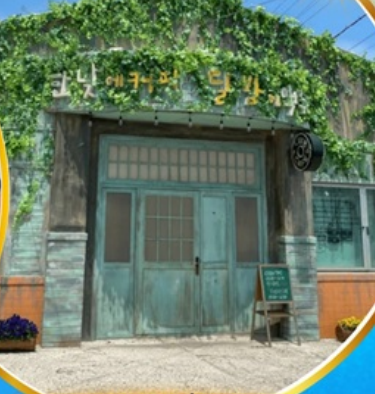
ตามรอยซีรีส์ดัง Hometown chachacha