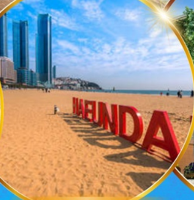
หาดแฮนแด