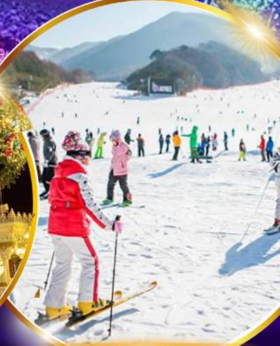
สกีรีสอร์ท

ชมจอ LED ขนาดยักษ์ที่รีสอร์ท 5 ดาว ใหญ่ที่สุดในเอเชียเหนือ สัมพัสมะสกีรีสอร์ท สกีรีสอร์ท สวนสนุกเอเวอร์แลนด์ ชมพระราชวังคยองบกคุง ย้อนอดีตหมู่บ้านบุกซอน ฮันอก อิสระช้อปปิ้งคังนัม Lotte Duty Free