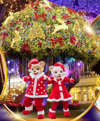
สวนสนุกเอเวอร์แลนด์ ฮิม พาร์ค