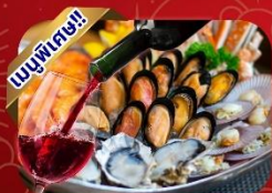
ซีฟู้ดไฮน์แดง