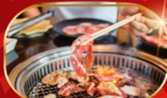
บุฟเฟ่ต์ปิ้งย่าง ไม่อั้น