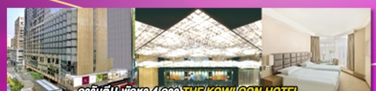
การันตี!! พิเศษ 4 ดาว THE KOWLOON HOTEL ติดถนนนาราน ย่านช้อปปิ้งจิมซาจู้