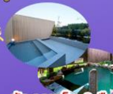
พักออนเซ็น 2 คืน