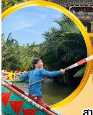
นั่งเรือกระดังง์