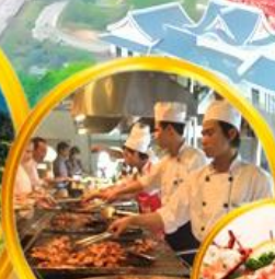
บุฟเฟ่ต์นานาชาติ