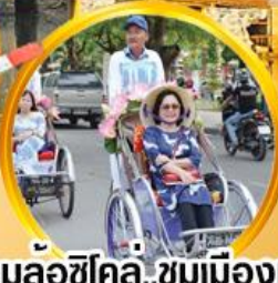
สามล้อซิคิลี่ ชมเมืองเก่า