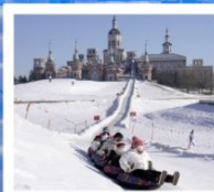
คฤหาสน์วอลการ์