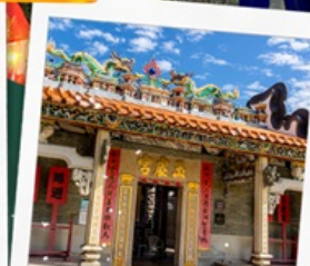
วัดปักไต่