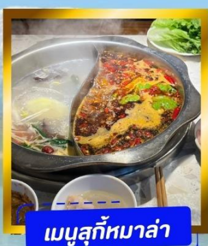
เมนูสุกที่มาแล้ว