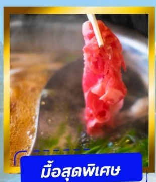
มือสุดพิเศษ