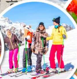
เล่นสกีจุใจ