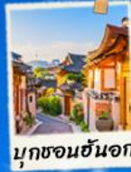
มุกซอนฮันอก