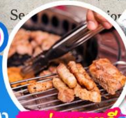
เมนูย่างเกาหลี