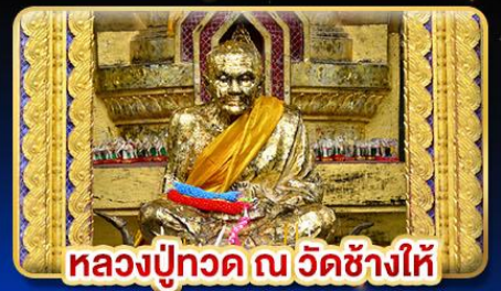
หลวงปู่ทวด ณ วัดช้างไห้