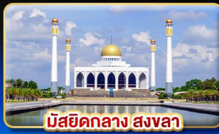
มัสยิดกลาง สงขลา