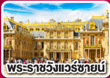
พระราชวังแวร์ซายน์