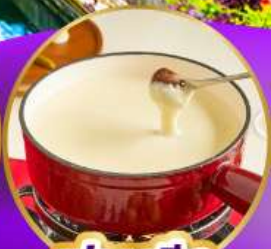
ฟองดูซีส