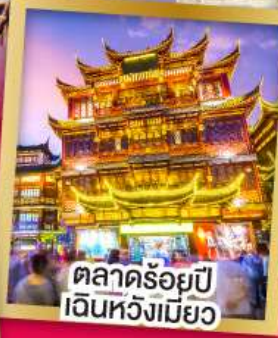
ตลาดร้อยปี เงินหั่งเมี่ยว