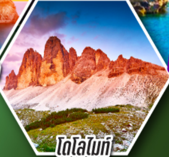
โดโลไมท์

โปรแกรมเดียว เก็บครบจบ อิตาลี ตั้งแต่เหนือถึงใต้