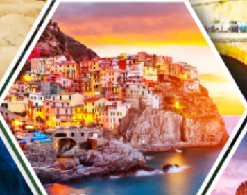
หมู่บ้านมาราโรลา