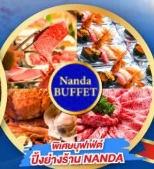
พิเศษบุฟเฟ่ต์ บึงย่างร้าน NANDA

เดินทาง (วันปีใหม่ 2568) 27 ธ.ค.-01 ม.ค. 68 29 ธ.ค.-03 ม.ค. 68