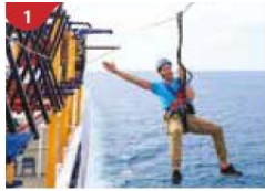
1 Ropes Course & Zipline Feel the thrill of gliding above the ocean on a 35-metre zipline.