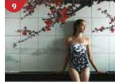
9 Crystal Life™ Spa Rejuvenate mind, body and soul with our holistic Western and Asian spa experience.