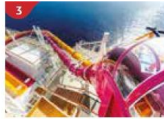
3 Waterslide Park Get drenched in fun on one of our six different waterslides.