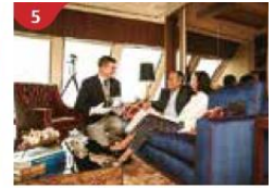
5 The Palace Indulge in European-style butler service and exclusive facilities.