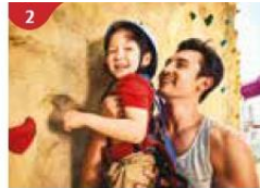
2 Rock Climbing Wall Challenge yourself on our mountainous rock climbing wall.