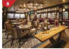
8 Bistro By Mark Best Relish contemporary Western cuisine from the internationally-acclaimed Australian chef.