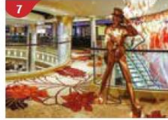
7 Johnnie Walker House™ Immerse yourself in the intricate world of premium Scotch whisky.