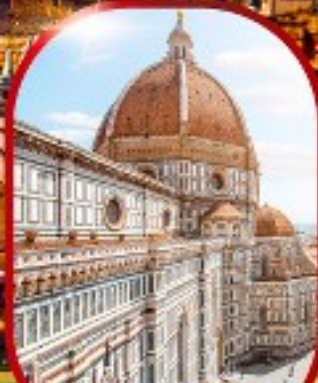
มหาวิหารฟลอเรนซ์