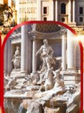
น้ำพุเทรวี

เดินทาง 15-22 พ.ย.67 28 พ.ย. - 5 ธ.ค.67 26 ธ.ค.67 - 2 ม.ค.68(ปีใหม่) 28 ธ.ค.67 - 4 ม.ค.68(ปีใหม่)