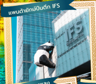
แพนด้ายักษ์ปิ่นตึก IFS