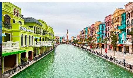
เมกาแกรนด์เวิลด์ฮานอย

*ทางบริษัทฯ ขอสงวนสิทธิ์ในการสลับโปรแกรมทัวร์ตามความเหมาะสมขึ้นอยู่กับสถานการณ์หน้างาน โดยคำนึงถึงผลประโยชน์ของลูกค้าเป็นสำคัญ