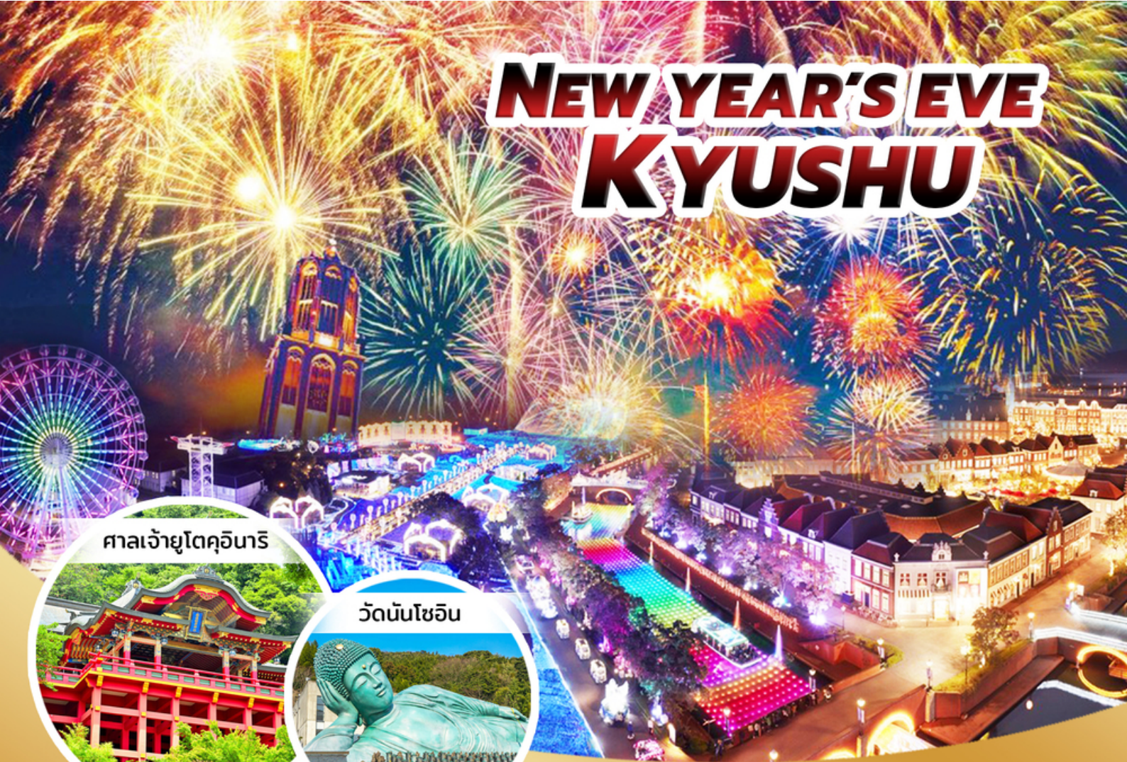
ศาลเจ้ายูโตคุอินาริ