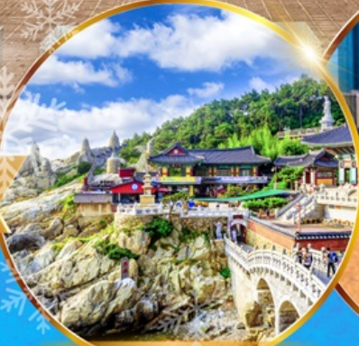
วัดแสงยงกุงซา