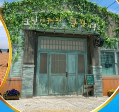
ตามรอยซีรีส์ดัง Hometown chachacha