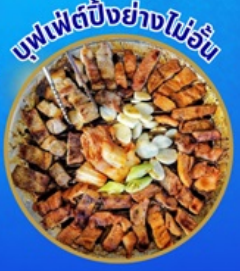
บุฟเฟ่ต์ปิ้งย่างไม่อั้น