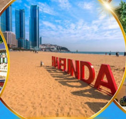
หาดแฮนแด