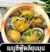
เมนูซีฟู้ดลิ้นมดุน