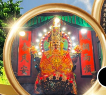
ขอพรซื้อขายสังหาริมทรัพย์