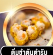
ต้มซ่าตันตำรับ