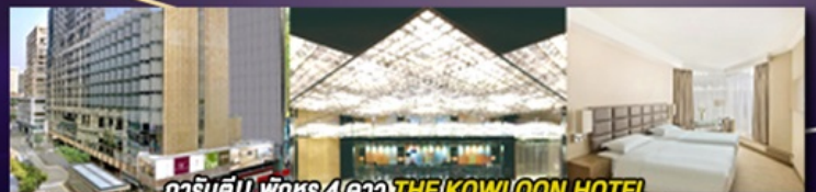
การ์นดี!! พิททุ 4 ดาว THE KOWLOON HOTEL ติดถนนนาราน ย่านช้อปปิ้งจิมซาจู้