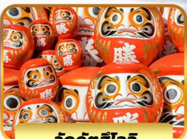
วัดคิตสึโอจิ