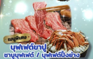
เมนูพิเศษ

บุฟเฟต์ขาปู ชาบูบุฟเฟต์ / บุฟเฟต์บึงย่าง