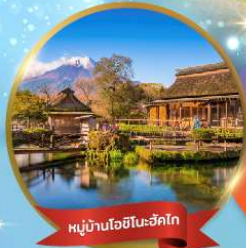
หมู่บ้านโอชิโนะฮักโก