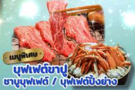
เมนูพิเศษ บุฟเฟ่ต์ข้าว ซาซิมิบุฟเฟ่ต์ / บุฟเฟ่ต์บิงชัง

ราคารวมทิปไกด์แล้ว 📍 พักออนเซ็น 1 คืน 📍 พักติดย่านช้อปปิ้ง 3 คืน