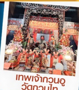
เทพเจ้ากวนอู วัดกวนไท่