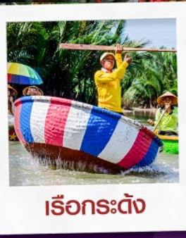
เรือกระด้าง