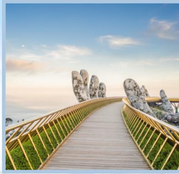
Le Jardin d'Amour Gardens