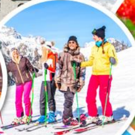
เล่นสกีจุใจ