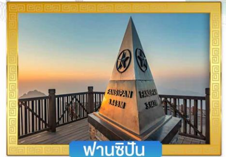
ฟานซีปัน