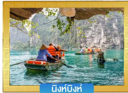
นิงห์บิงห์