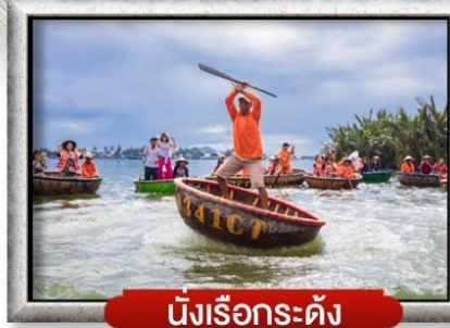
นั่งเรือกระดัง