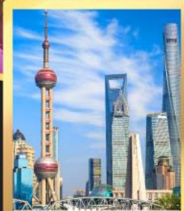
เชียงใหม่