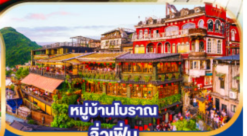
หมู่บ้านโบราณ จัวเฟิ่น