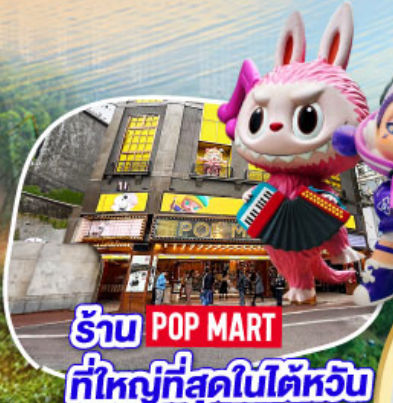
ร้าน POP MART ที่ใหญ่ที่สุดในไต้หวัน