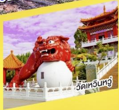
วัดหัวหน่วง