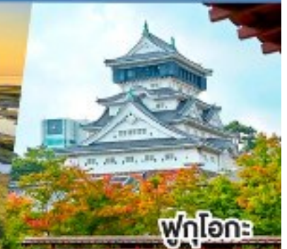
ฟุกุโอกะ