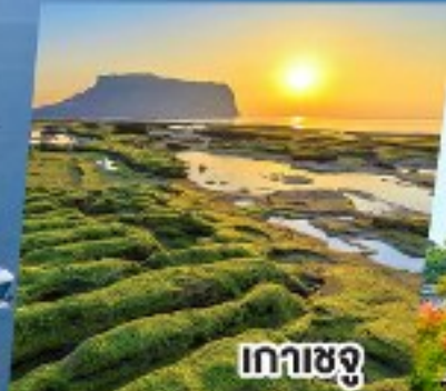
เกาะเชจู