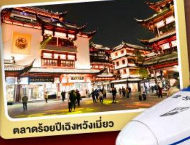
ตลาดร้อยปีเจิ้งหวิงเมี่ยว