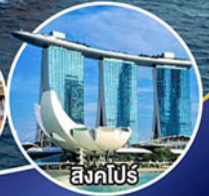
สิงคโปร์