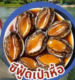
ซีฟู้ดเป่าหื้อ