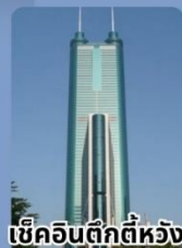
เช็กอินตึกตีห้วง