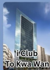
i Club To Kwa Wan