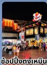
ช้อปปิ้งตงเหมิน