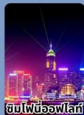
ชมไฟนีออนไฟรี่