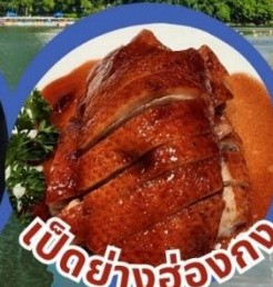
เป็ดย่างฮ่องกง