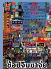
ช้อปปิ้งจางจ๋วย