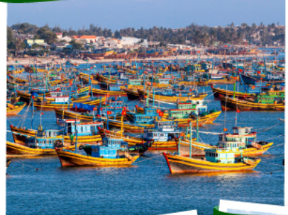
หมู่บ้านชาวประมงมุยเน่