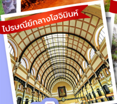
โพรเซนียกกลางโฮจิมินห์