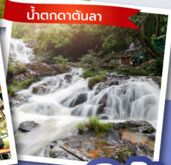
น้ำตกตาตันลา