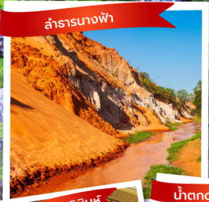
ลำธารนางฟ้า