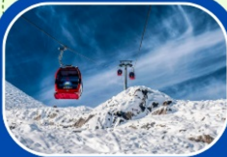
ต้ากู่ปิงชวน