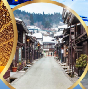
ทาคายาม่า