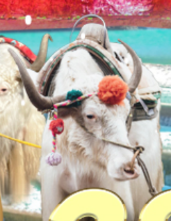
ราคาเริ่มต้น