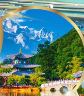
สระมิงกรดำ