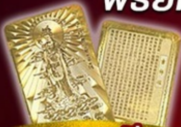
แถมพรี แผ่นทองเจ้าแม่กวนอิม