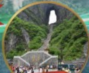
กำแพงประตูสวรรค์