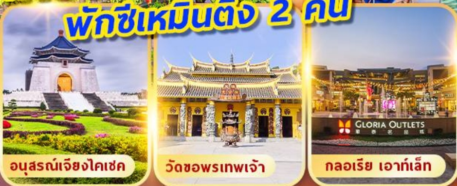
อนุสรณ์เจียงไคเชค