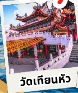
วัดเทียนหัว