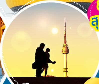
NEW! มุมลับ! หอคอย N โซล